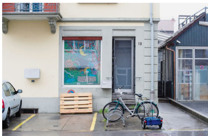
Das Sleep-In in Biel wird auch von Sans-Papiers aufgesucht. PETER SAMUEL JAGGI

Quelle: Studie Sans-Papiers in der Schweiz, 2015, B, S, S, Volkswirtschaftliche Beratung