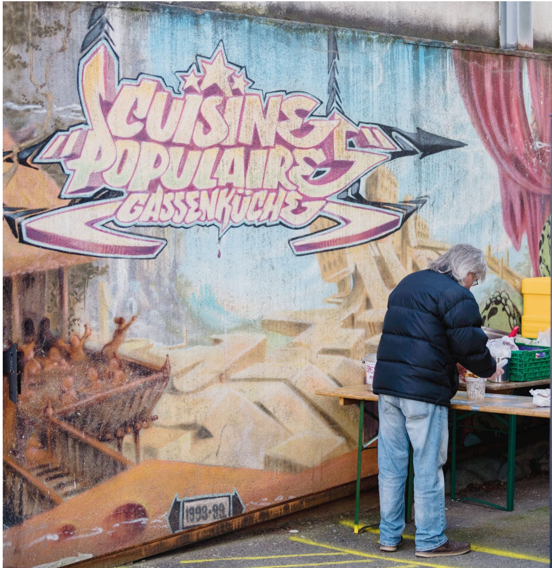
Gelegenheitsjob verloren, kein Geld fürs Essen. Bei der Gassenküche gibt es eine warme Mahlzeit zum Mitnehmen.